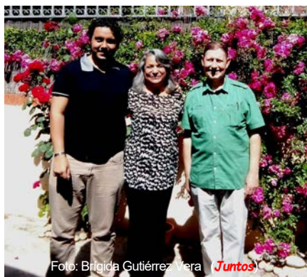
Juntos

habían estado unos días de viaje por diferentes países de Europa. El domingo 26, celebración de la Trinidad, se unieron a nosotros en la congregación.