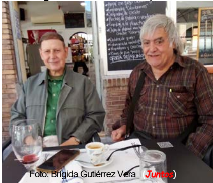
Juntos