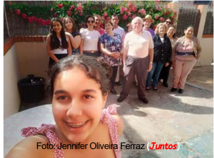
Juntos